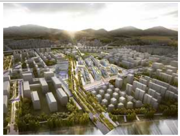
[인천계양 지구 최우수작 조감도(지구계획 수립 시 변경 가능)]