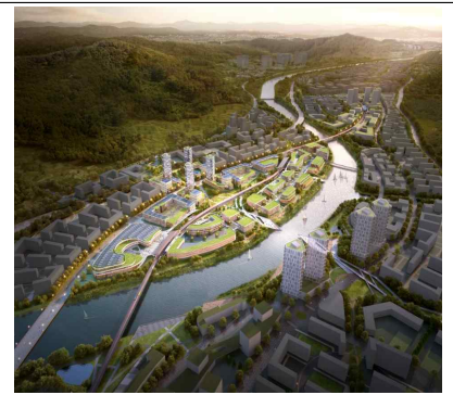
수변 지역 특화구역