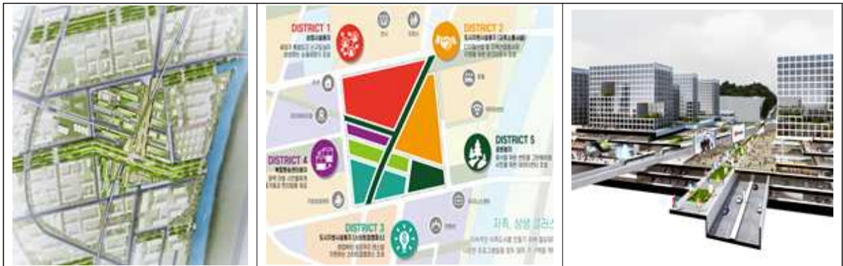
[특화구역 조감도 및 주요 계획 요소]

□ 남북의 S-BRT 노선과 동서의 계양산과 굴포천을 잇는 녹지축의 교차점을 특화구역으로 설정하고 복합환승센터, 기업·상업용지, 스타트업캠퍼스 등이 어우러지는 첨단산업 클러스터로 조성한다.