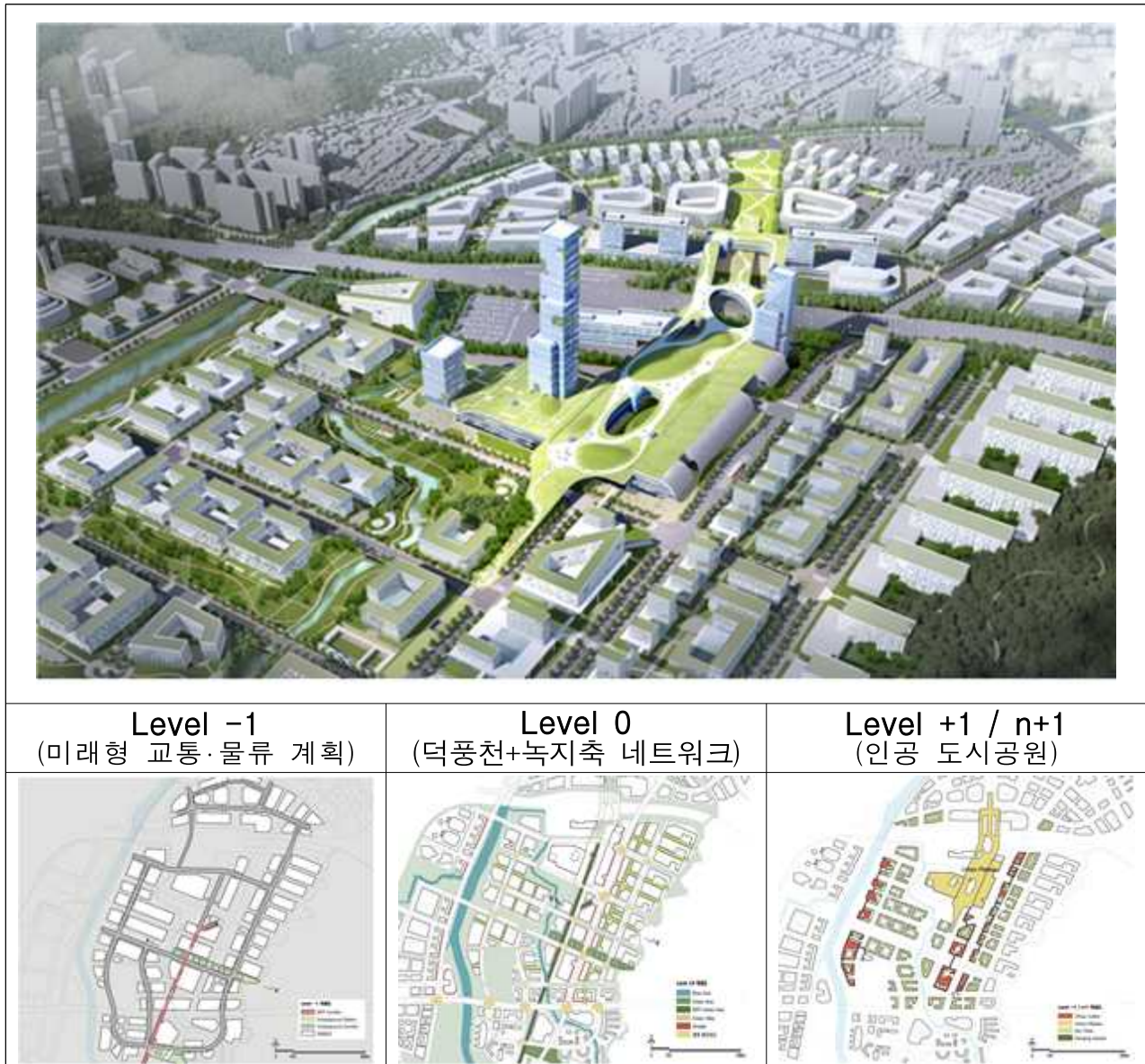
< 특화구역 조감도 >