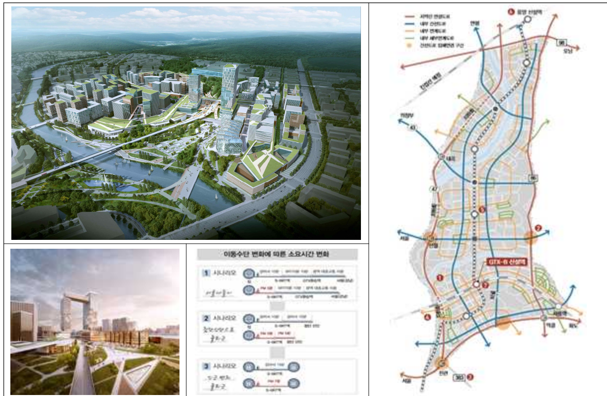
< 특화구역 조감도 >